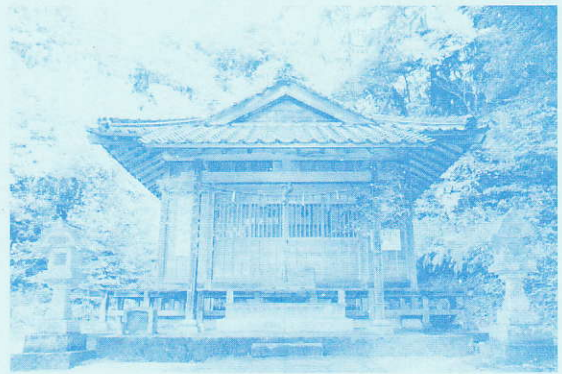
よしはら 葭原神社

昔から円護寺地区の氏神様として大切に奉られてきました。春祭り、秋祭り、新嘗祭などの祭典があります。