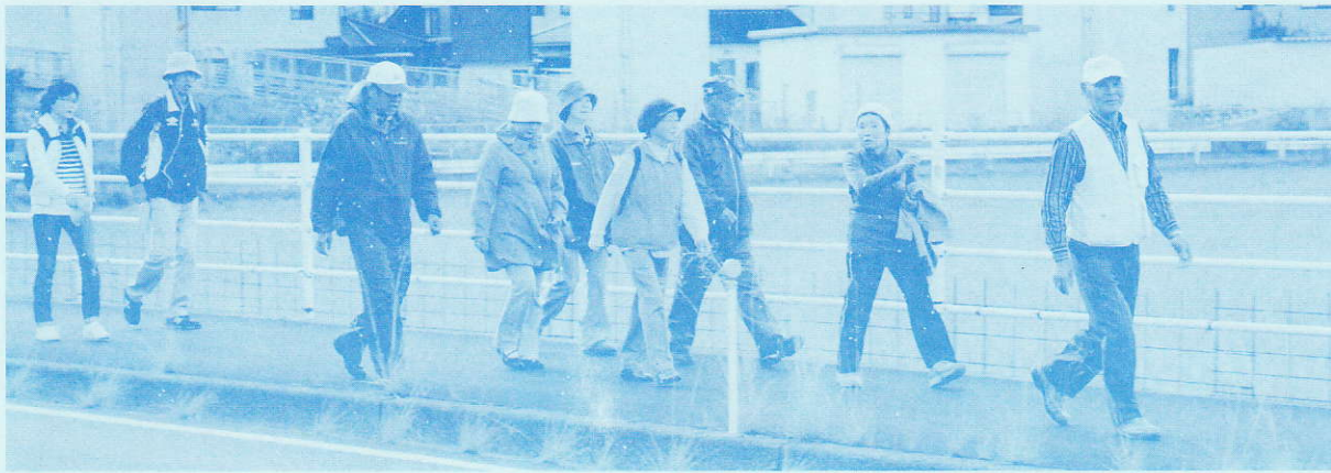
出発したばかりのみなさん。元気で！ 余裕があります！

前日までの天気とは打って変わって、秋のすばらしい日差しの中、覚寺の歴史ある史跡に昔の人の往来を想いながら、また輝く紅葉を愛でながら、どんぐりをさがし、あけびを見つけてのウォーキングとなりました。いつも吸ってる空気とは違う空気に参加のみなさんは満足されていきました。