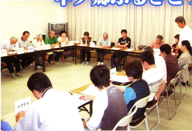
「ふるさとづくり協議会」会議風景