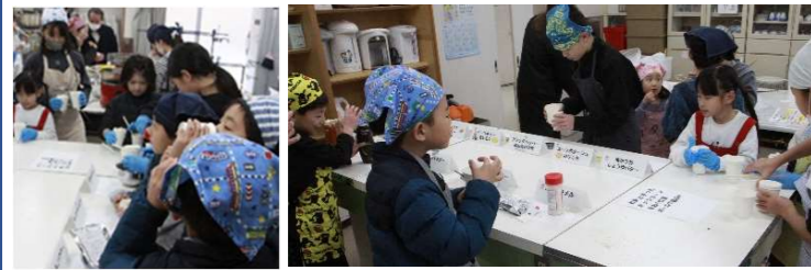
ポップコーンの味つけフレーバーの選択と味つけ

「塩キャラメル」「キャラメルシュガー」「いちご」「パーベキュー味」「塩レモン」「ブラックペッパー」「めんたいマヨ」「梅かつお」「醤油バター」「チーズ」「ハニーバター」「コーンポタージュ」「のりしお」「コンソメ」「カレー」「ガーリック」「たこ焼き味」の17種類と、トッピング用の「チョコレートソース」と「キャラメルソース」の2種類