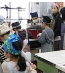
綿あめ食べながらポップコーン待ち