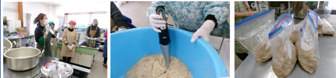
☆ 参加者の声 ☆

昨年好評だった、「味噌づくり」を行いました。参加希望者が多く、予定より人数を増やして実施。米と麦の合わせ麹で作った味噌をジップロックで保存しました。6月ごろの出来上がりがとても楽しみです。