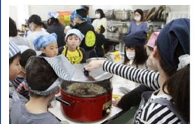
ポップコーン出来上がり待ち