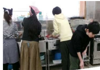
後片づけも参加者で