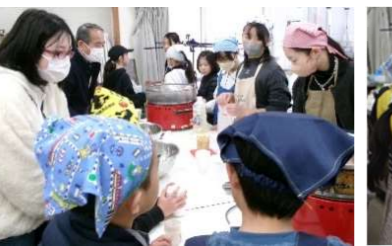
ポップコーン保護者も一緒に