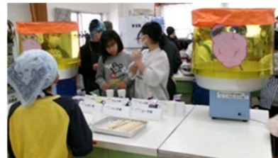
綿あめ担当ザラメを慎重に計量