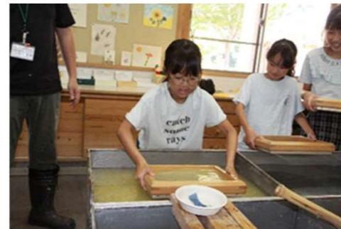
恐る恐るの手つきでチャレンジ