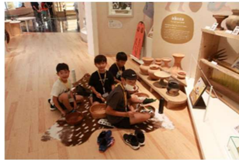
弥生人になって楽しんでいます