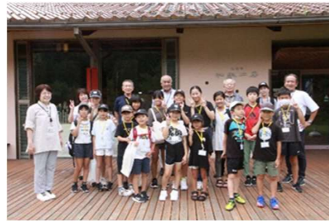
和紙工房前で記念撮影

青谷かみじち史跡公園では、弥生時代の青谷を再現した展示室から、見て触って青谷上寺地遺跡や弥生時代の歴史を学習しながら青谷弥生人の生活文化の様子を興味深く見学しました。