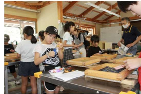
真剣な眼差しで何かを切っている

和紙工房では、最初に因州和紙の歴史や原料を勉強しました。次に、紙すき体験しながら和紙ができる工程を学ぶことができました。特に手すき和紙体験では、すき上げた和紙の上に色和紙を好きなデザインに配置してオリジナルの和紙を手作りします。子どもたちは事前に考えてきたデザインを丁寧にかつ慎重に色和紙を使って作り上げていました。