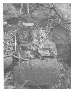
図2-25 不動明王立像の脚部