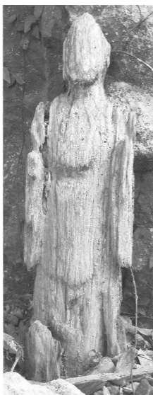
図2-22 木彫仏 (平安末)

岩陰の下段に祀られている仏像群は、北側から石造阿弥陀如来坐像、石造不動明王立像(脚部)、石造地藏菩薩立像、石造菩薩立像(脚部)、木造の仏像(木彫仏)、少し離れて石造千手観音菩薩立像と並ぶ(図2-23)。仏像の像容はそれぞれ異なり、年代的にも幅があると思われる。その中で注目されるのが、左端近くに位置する木彫仏である(図2-22)。風蝕による朽損が進んでおり、如来像か菩薩像かを明確にしがたいが、一木造りの立像で、右手は脇腹のあたりで肘を曲げ、左手は体側に垂下する姿に造る。現在の像総高は57cm。年代も朽損のため明確にできないが、一木造りであることや頭部と軀部等全体のバランス、わずかにみられる衣文の特徴等から平安末期前後に位置付けられる可能性がある。