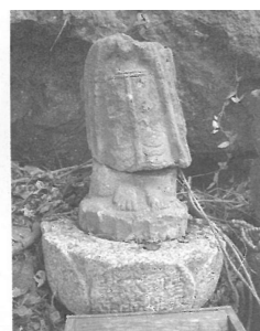
図2-26 菩薩立像の脚部