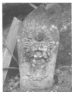
図2-27 千手観音菩薩立像