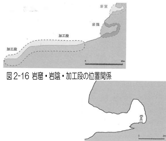
図 2-17 岩窟仏堂内部 断面図

鳥取環境大学教授 浅川慈男氏著作「摩尼寺『奥の院』遺跡—発掘調査と復元研究」(2012年3月発行)より転載