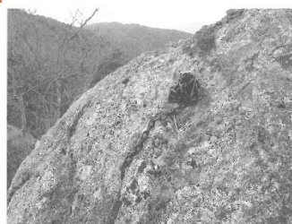
図2-12 立岩の頂に残る鎖の残骸

立岩の周辺には平坦地がひろがっている。昭和初年の立岩周辺の写真を見ると、仏堂と平屋の鐘楼がみられる(図2-14)。通常、山頂付近の仏界に堂宇を建てることはあまりないのだが、摩尼寺の「鷲が峰」には閻魔堂があった。「鷲が峰」一体は「賽の河原」と呼ばれており、「田中1983:p.22」、古写真の仏堂すなわち閻魔堂に死者を裁く閻魔大王を祀っていたのである[鳥取県1973:p.535]。山中他界信仰の聖地であった摩尼山ならではの祭場といえるだろう。閻魔堂は昭和18年(1943)の鳥取大地震で崩壊し、鐘楼は老朽化のため十数年ほど前に撤去された。現在は、仏堂の基壇と鐘楼の礎石が当初の位置に残っており、鐘楼の柱材が礎石の脇に山積みされている。縁起書が誇示するように、立岩からは日本海や湖山池が一望できる。快晴の日には大山をも視界に納めることができると言われている。