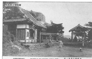
図2-14 絵葉書にみる山頂の閻魔堂 [鳥取県立博物館HPにより転載]

鳥取環境大学教授 浅川慈男氏著作「摩尼寺『奥の院』遺跡一発掘調査と復元研究」(2012年3月発行)より転載