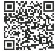
中ノ郷地区公民館QRコード