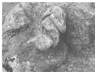
図2-13 立岩の頂に置かれた石仏