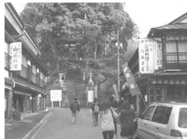
図2-3 摩尼寺門前の茶屋