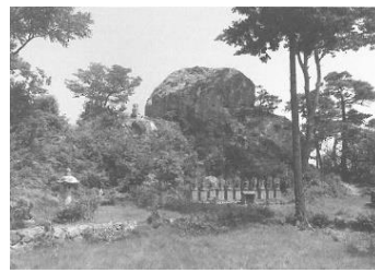
図2-4 帝釈天が降臨した「立岩」