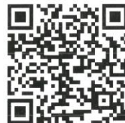
中ノ郷地区公民館QRコード

No.339 令和5年7月1日 中ノ郷地区公民館 鳥取市覚寺118 電話 21-5393 FAX 21-5409 http://chiiki.city.tottori.tottori.jp/nakago-1/