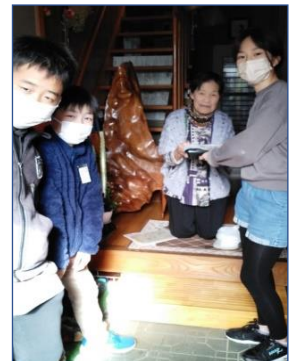
5年生が、手作り弁当とお豆腐を手渡しました