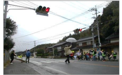
地域の方たちと一緒に、校長先生も安全確認！

まず、最初に登校する姿が見えたのは土居方面。寒さに負けず元気な姿の子どもたちの顔を見ると、大人の「おはよう！」の声も自然に元気に。子どもたち全員が校門へ入るのを見送りました。