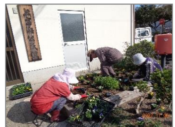
上高浜公民館前の花植えの様子

各区長さんをはじめ、集落のみなさんには、「緑の募金事業」の花植え、また「コスモスロード維持管理整備事業」ではコスモスの