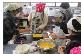
手作り豆腐の配達