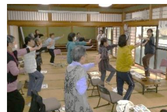
「頭と身体の体操 グーパーグーパー」

「とっとり式認知症予防プログラム」に14名が参加しました。作業療法士さんと一緒に、椅子に座った体操、足先で新聞紙を丸めたり折りたたんだり。知的活動に「有名人名前合わせゲーム」で会話と笑いで盛り上がりました。