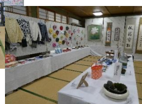
地域、サークルの作品