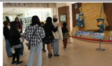
名探偵コナンがお出迎え