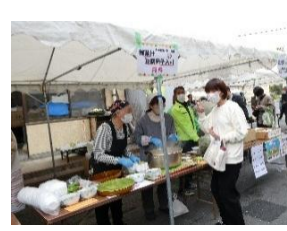
食育 貝だくさん汁