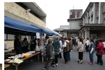
バザーには行列も！