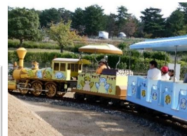
鳥取砂丘こどもの国 レールトレイン「サンド号」に乗ったよ