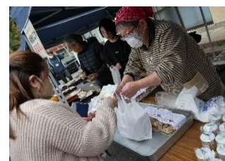
瑞穂おこわ 大盛況！