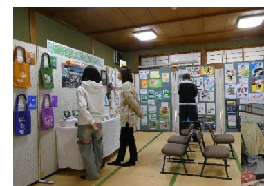
保育園、中学校 公民館事業の作品

百花繚蘭の華やかなオープニングイベントで始まり、さまざまな活動発表や、「しゃんしゃん体操」「マジックショー」など会場は大盛り上がりでした。