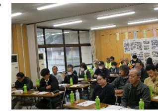
各集落の状況を把握