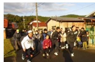
令和7年度の様子(土居)