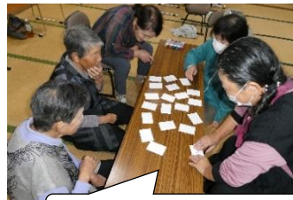
あら、懐かしい名前