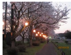
桜つつみライトアップ

△桜つつみさくら祭り2022 △地区納涼七夕まつり △お月見会 △地区新年のつどい △宮下音頭の踊りの普及