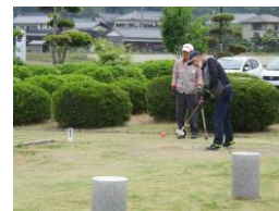
さつきまつりGG大会