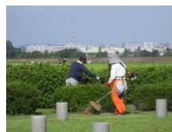
史跡公園(因幡国庁跡)