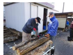
椎茸原木穴あけ作業