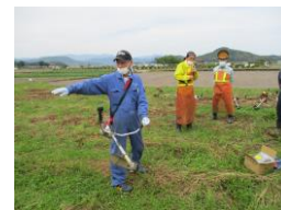
草刈り機(刈払機)操作実技講習会