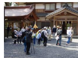
国府町史跡探求勉強会