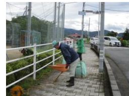
地区周辺一斉清掃(小学校前)