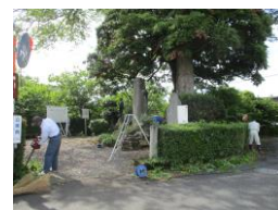
史跡公園(大伴家持歌碑)