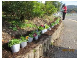
花いっぱい運動(国府大橋)