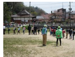
宮ノ下っ子見守り活動