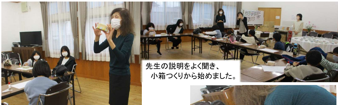
先生の説明をよく聞き、 小箱づくりから始めました。