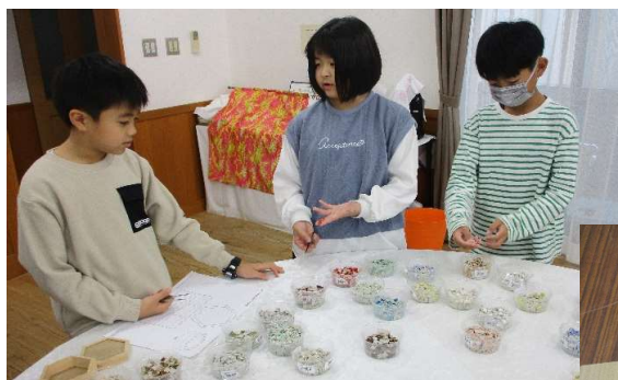
沢山のタイルで目移りしちゃう?!