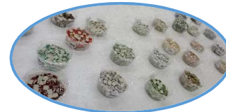
思い通りにできるかな?