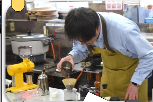
やさしくていねいな指導でした