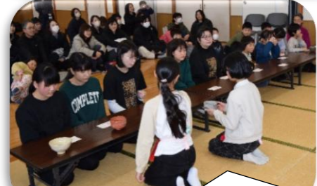
参加者みんなにお茶とお菓子を振舞い