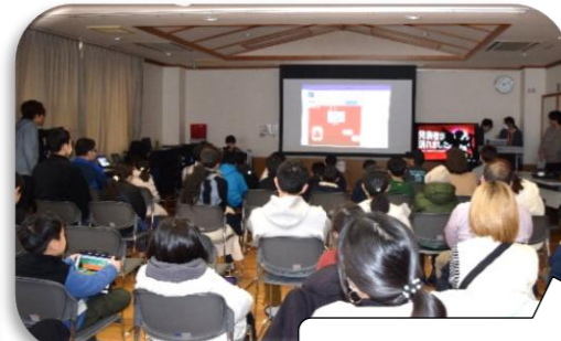
1人、3分程度の発表でした