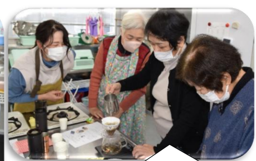
色々な種類のコーヒーを入れ、味の変化を楽しみました