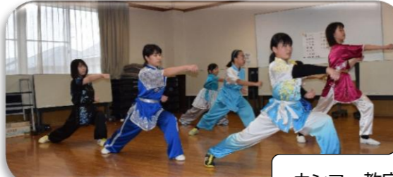
カンフー教室 演技