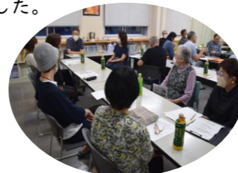
6/21 美保地区公民館にて

南大覚寺は、資源回収の後、小地域懇談会を開催しました。「話せてよかった」のDVDを視聴し、今年度はグループで簡単に話し合い懇談会を終わりました。