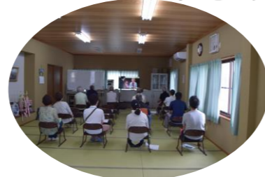
6/10 ふれあい会館にて

南大覚寺は、資源回収の後、小地域懇談会を開催しました。「話せてよかった」のDVDを視聴し、今年度はグループで簡単に話し合い懇談会を終わりました。