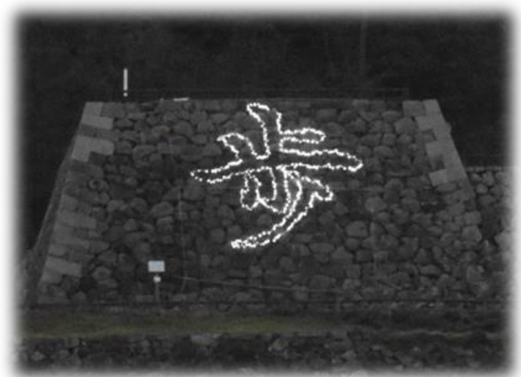
【写真は昨年のイルミネーション・歩の一文字】