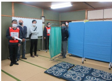
【和室(妊婦・乳児室)】