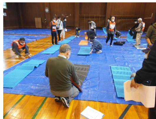
【体育館(一般避難者)】