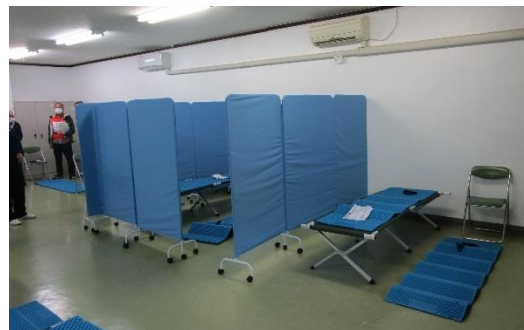
【第1研修室(発熱・体調不良者室)】