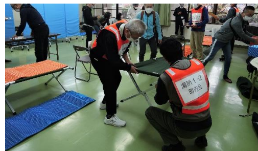
【第2・3研修室(要配慮・要支援者室)】