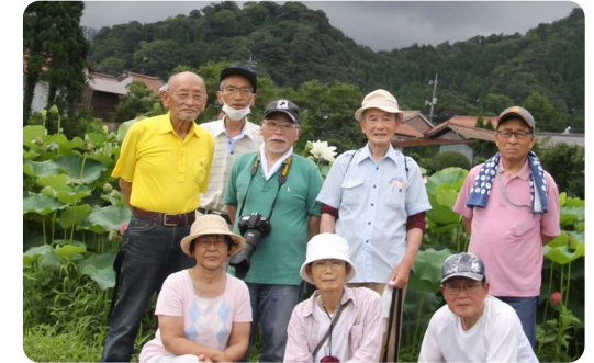
《7/30 鹿野蓮(ハス)の撮影会》