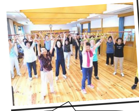
～しゃんしゃん体操～