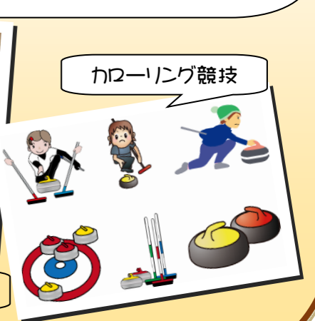
カローリング競技