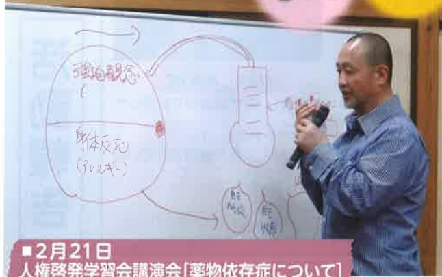
2月21日 人権啓発学習会講演会(薬物依存症について)