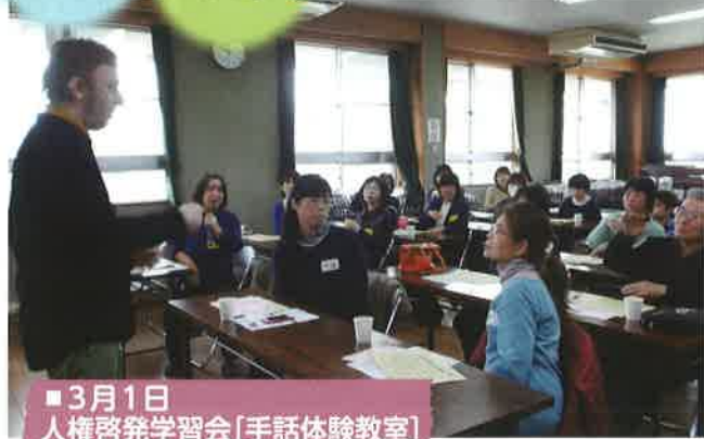
3月1日 人権啓発学習会(手話体験教室)