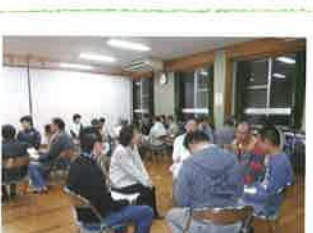
10/27日 さざなみ・二本松

・人権を話題にした集会を、年1回は地域で自主的に行うと良い。 ・繰り返しが必要だと思った。 ・「一歩踏み出せば何でも出来る」まちづくりボランティアなどへ参加する一歩だと。 ・地域との関わりが今後も重要である事を再認識した。