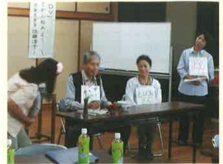
湖山地区の推進員による「人権劇」