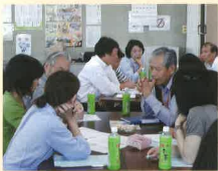
DVIについてグループワーク