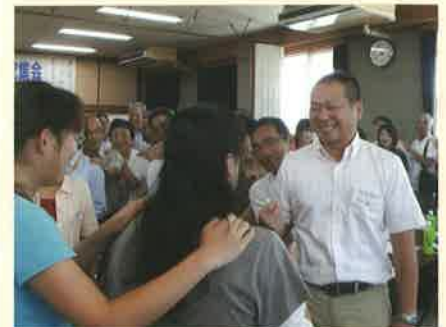
アイスブレイク「ジャンケン列車」