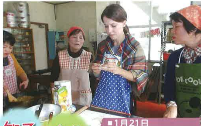
1月21日 男女共同参画(ロシア料理教室)