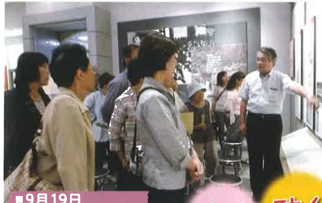
9月19日 県外現地研修(福山市)

2014年(平成26年)3月28日 編集・発行 湖山地区人権啓発推進協議会 〒680-0941 鳥取市湖山町北6丁目334 TEL (0857) 28-1017 FAX (0857) 28-1119