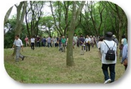
実際に天神山に登ってみました