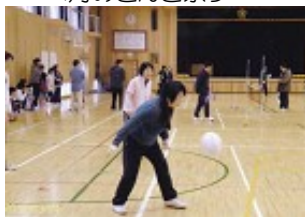
3月の新川区体育祭