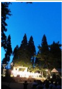
八幡山神社の境内で行われる