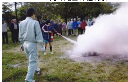
11月の防災訓練(初期消火訓練)

し体験する。湖山神社例祭は、家内安全、収穫への感謝、そして祭りの無事を祈願し、若い人たちが大勢参加、協力してくれて、新川区の伝統を次の世代にしっかり引き継ぐ大きな役目を果たしている。年末総会は決算の承認と三役(任期1年)が選挙にて選出され