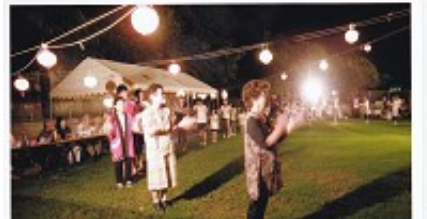
7月の新川区納涼祭