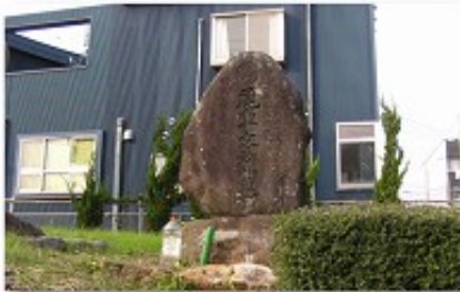
尾車文五郎の力士塚