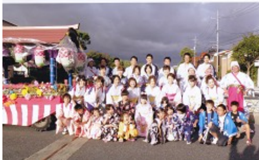
10月の湖山神社例祭