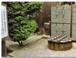
和泉式部の産水の井戸

来年9月から湖山池公園で開催される「第30回全国都市緑化とっとりフェア」に向けて、湖山地区内の史跡・遺産等を整備するため、都市緑化フェア事務局他関係者5名と自治会ヒストリーロード整備準備委員7名が、7月6日、現地視察を実施しました。