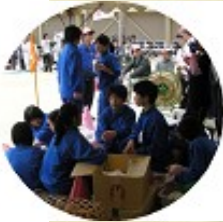
中学生もボランティアで運動会を盛り上げてくれました。

五月晴れの中、「第79回湖山校区民大運動会」が5月13(日)、湖山小学校グラウンドで開催され、小学校児童及び湖山地区23町区から参加した多くの区民が各競技にさわやかな汗を流しました。総合順位は、最終競技のオンパレードまで1位が決まらず、大接戦の末、南2丁目が優勝しました。