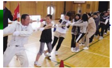
4月の新川区大運動会

し体験する。湖山神社例祭は、家内安全、収穫への感謝、そして祭りの無事を祈願し、若い人たちが大勢参加、協力してくれて、新川区の伝統を次の世代にしっかり引き継ぐ大きな役目を果たしている。年末総会は決算の承認と三役(任期1年)が選挙にて選出され