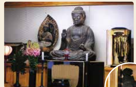
栖岸寺の薬師如来像と猫のミイラ(右)

心を説いてくださいました。私は一晩で池になってしまった湖山池でおぼれて死んでしまいましたが、お薬師さまのおかげで仏様になることができました」お坊さんは夢から覚めてお薬師さまを見ると、下の方から何やら光っています。見ると、光明を放つ1匹のミイラ(干猫)が見つかりました。その話を聞いた村人は、お薬師さまとこの猫のミイラを大切にお祀りするようになりました。そして、お薬師さまと猫をお祀りしたので「猫薬師」と呼ぶようになったということです。