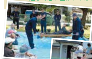
←防災訓練 「救急救命訓練」