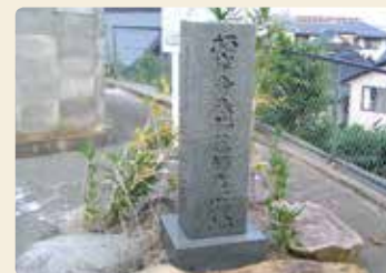
猫薬師庵跡地(湖山小学校グラウンド南側の墓地)