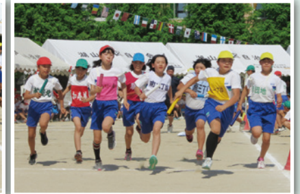
第82回湖山校区民大運動会 成績 2015年(平成27年)5月24日