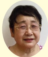
教育文化部長 邨上 啓子