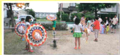
納涼祭で傘踊り披露