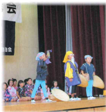
迫真の演技に思わず拍手