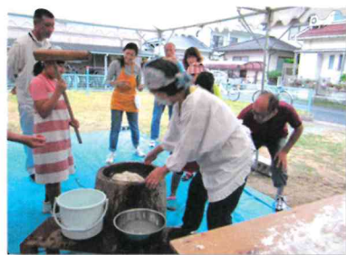
竣工記念の餅つき