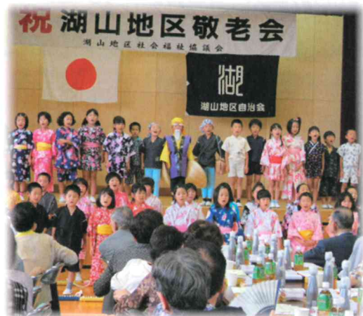
湖山小のみなさんによる「水戸黄門」

恒例の湖山地区敬老会(75歳の高齢者159名出席)は9月15日、湖山小学校体育館で開催されました。当日は鳥取市長からのお祝いメッセージなど、関係者からの祝辞をいただいた後、園児、小中学生による歌・踊り・演劇が披露されました。祝宴では壮年団のドジョウ掬い、子ども傘踊りなどを楽しみながら和気あいあいと歓談され、組体操の演技が決まると大きな拍手がおこりました。最後に地元のしおさいコーラスのみなさんと出席者全員で「青い山脈」などを合唱し、長寿を祝いました。ま