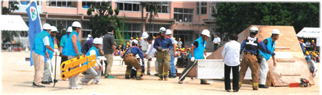
消防署員の指導による救出・救護訓練に真剣に取り組む

「鳥取県東部沖で大規模な地震が発生」という想定のもと、9月10日、鳥取市総合防災訓練が初めて湖山小学校校庭で行われました。また、湖山地区自主防災会との合同防災訓練とあって、23町区の住民が一堂に会し、初期消火訓練、救出・救護訓練、煙体験等、貴重な訓練を実施しました。