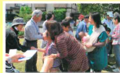
料理ワークショップ