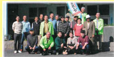
研修旅行「山陰海岸ジオパークの旅」