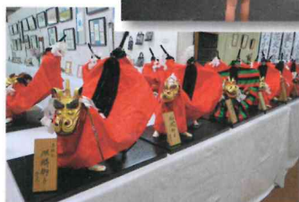
立派な作品が勢ぞろい