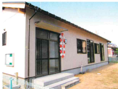
立派な集会所が完成しました