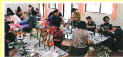
敬老会の贈り物を製作