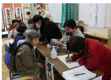
医療生協小鷺河支部 健康チェックコーナー