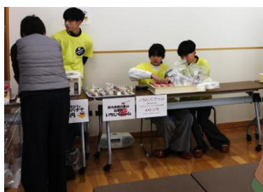
鹿野学園生徒による こわしがわカフェ