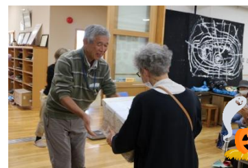
抽選会&かぼちゃ重量当てクイズ