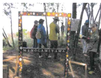
箕上山頂上 フォトフレーム

途中はちょっと険しいアップダウンもありますが、箕上山頂上は氷ノ山～鳥取市内～湖南地域～青谷の長尾鼻まで見渡せる大パノラマが広がっていました。