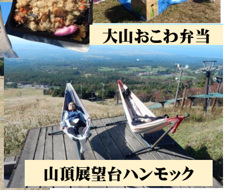
山頂展望台ハンモック