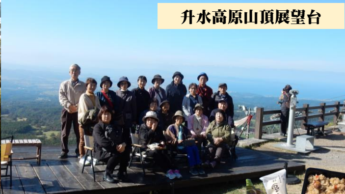
升水高原山頂展望台