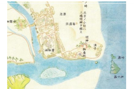
寛文大図(複製の一部)