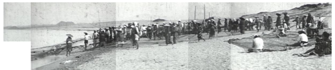
昭和7年賀露にマグロの大群が押し寄せた時の記録映像より抜粋

「有害ごみ」「乾電池・蛍光灯」収集日について 賀露 毎月 第4木曜日 南隈・晩稲 毎月 第1月曜日 ライターやスプレー缶類は、必ず中身を空にしてください。 穴をあける必要はありません。(開けてもよいです) 袋には入れないで、ごみステーションの収集容器へ直接 入れてください。 問合せ先 鳥取市 生活環境課(tel 0857-30-8084)