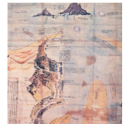
因州高草郡加路浦湊絵図(一部)