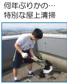
何年ぶりかの…特別な屋上清掃