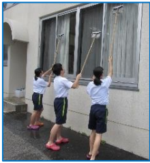
窓掃除のお陰で見晴し良くなりました