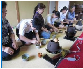
初めての茶道体験で凛とした静寂の世界を体験