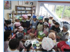
カップケーキ・フルーツムース

感想・・・簡単に作れて、家でも出来るかなと思った。サンドアートはきれいに出来ました☆次は、クレープがいいな♪ (3年女子)