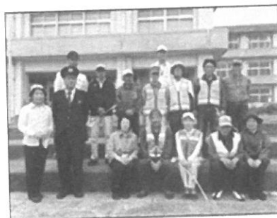
見守り隊のみなさん