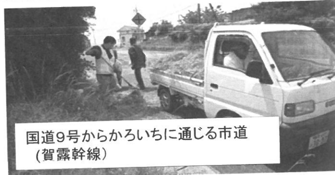
国道9号からかろいちに通じる市道 (賀露幹線)