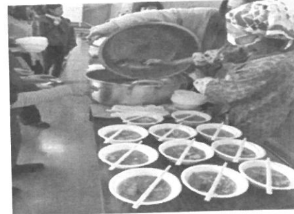
昼食は△とカレースープ 美味しかった! 完食