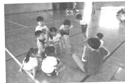
はじめましてお友達