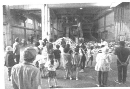
因幡環境リサイクルセンター