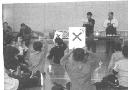
○×クイズ 賀露の海は、日本海?