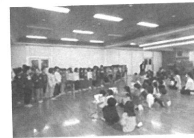
にこにこコンサート