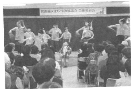
満員御礼 破竹の会(8区)