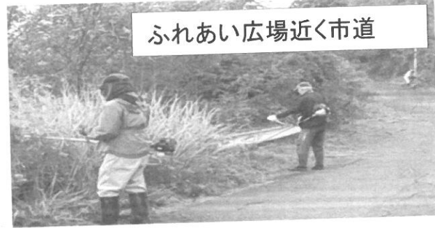
ふれあい広場近く市道