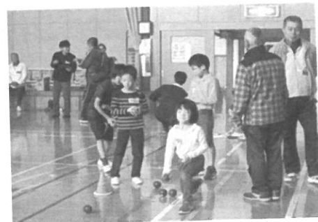
ニュースポーツ じいちゃん上手いなあ