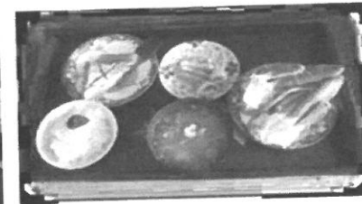
茹でカニ・刺身・煮魚・あら汁