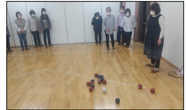
写真は、ボッチャの様子です。