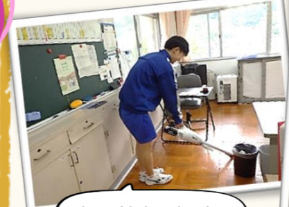
朝は館内の掃除からスタートです！

5月13日(火)～16日(金)の4日間にわたり、職場体験事業「ワクワクあおや」が実施され、青谷中学校2年生の見生さんが活動に参加しました。