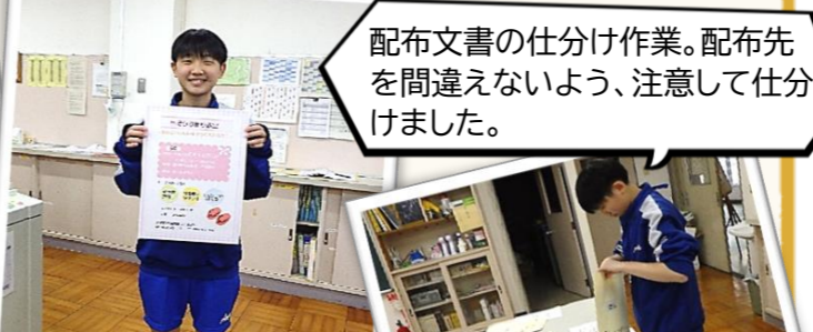
6月実施予定の公民館事業「布ぞうり作り教室」のポスターを作りました！