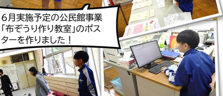
事務業務にも正確かつ丁寧に取り組みました。