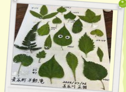
「完成したデジタル葉っぱ図鑑」

まちづくり協議会では、これからも皆様方楽しんでいただけるイベントを企画立案していこうと思っていますので、皆様のご参加をお待ちしています。