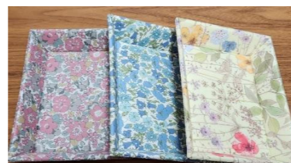
※見本は公民館にあります