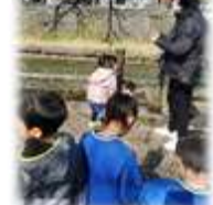
ボンボリの 取り付け作業

*お問い合わせ先 醇風地区まちづくり協議会 事務局/醇風地区公民館 TEL26-2568