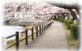
醇風夜ざくら道路