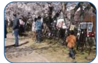
【あおぞらギャラリー】