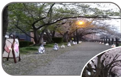
醇風夜ざくら道路 風景

ぼんぼりは3月下旬～4月上旬に設置予定です。設置期間中は日没時に毎日点灯します。和紙あかりを上記期間中で天候の良い2日間に灯します。(18:30頃～21:00頃まで) 夜空に咲く桜と地域の皆さんの作品を楽しみにお出かけください。