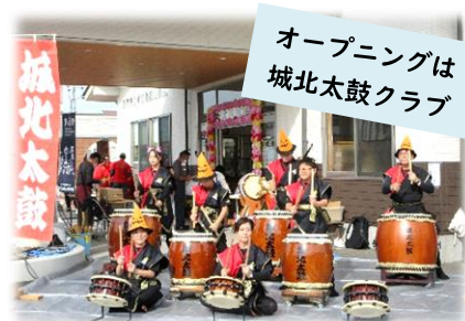
オープニングは 城北太鼓クラブ