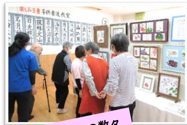
素晴らしい作品の数々