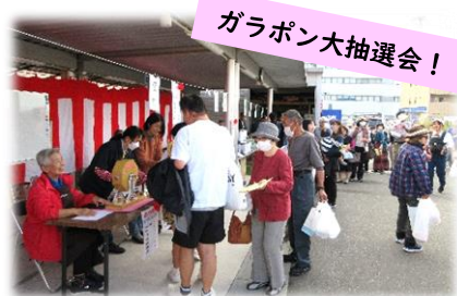
ガラポン大抽選会!