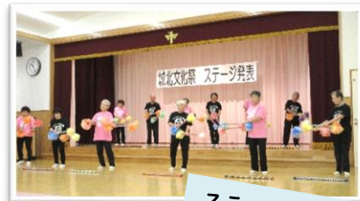
ステージ発表♪ 10団体出演