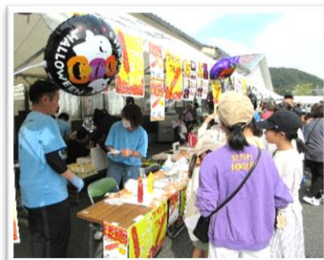
イベント会場 大賑わい!