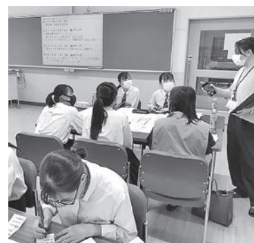
グループに分かれての取りまとめ

生徒の皆さんは、福祉関係に進む志を持った方なので、積極的な姿勢と若い発想に関心すると共に意見交換が出来たことなど大変有意義な時間でした。