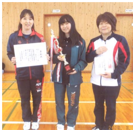
【レディースの部優勝：卯垣四丁目チームの皆さん】

水温み楽しくなりし厨事 嘯り風を入れたる仏間かな 遠き日の母と海苔搔く思ひ出を 退院の目に柔らかな木の芽かな 馴染みきし平成惜しむ春炬燵