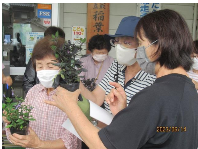
ピンカ(日々草)、スクテラリア、観賞用トウガラシ、シレネ・ユニフロラを植えました