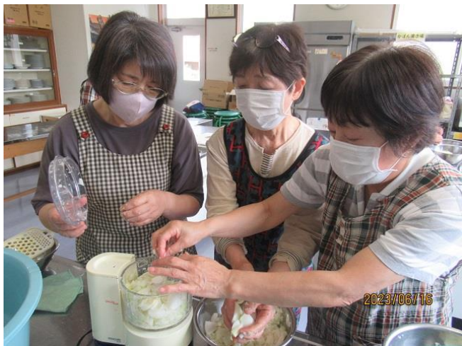
効果がしっかり発揮されることを願います！