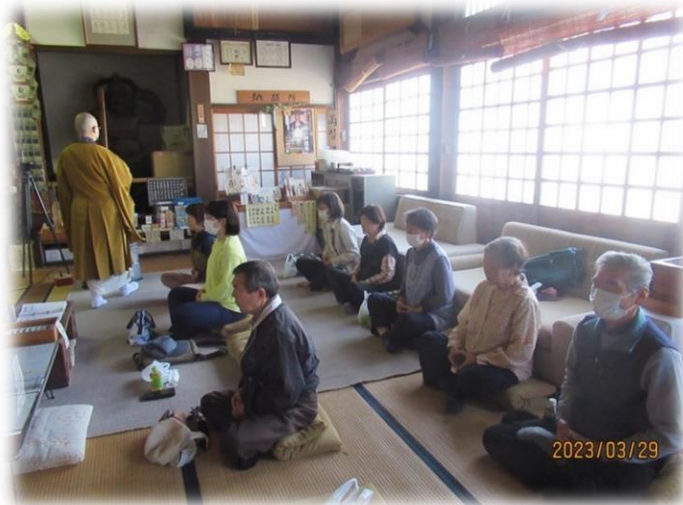
貴重な仏像が何体もある本堂で座禅体験をさせていただきました