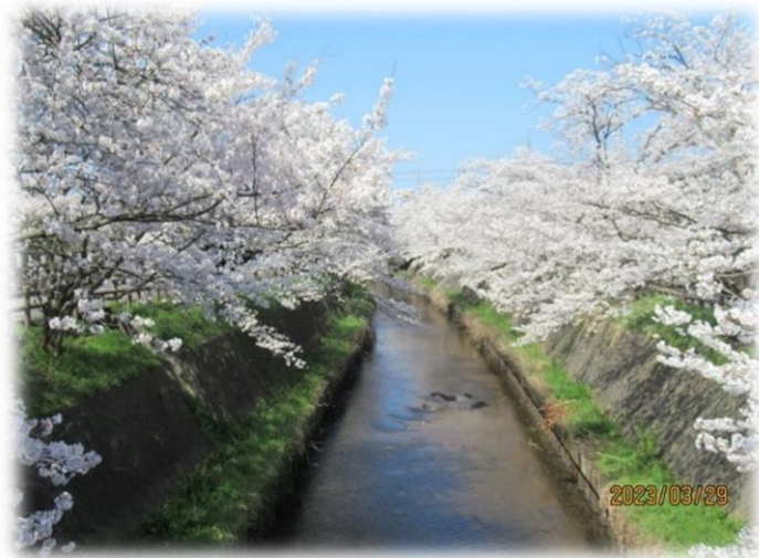
満開！天神川沿いの桜が見事でした！