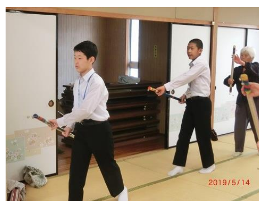
しゃんしゃん体操への参加

5月13日～17日の間、鳥取東中学校2年生2名が職場体験に来ました。運動会の準備や公民館事業への参加など、一生懸命頑張ってくれました。