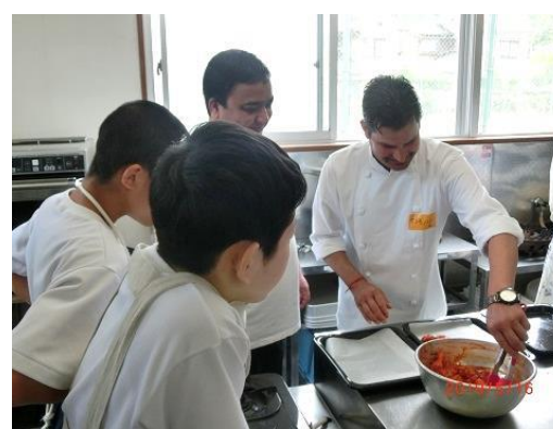
インド料理に挑戦!