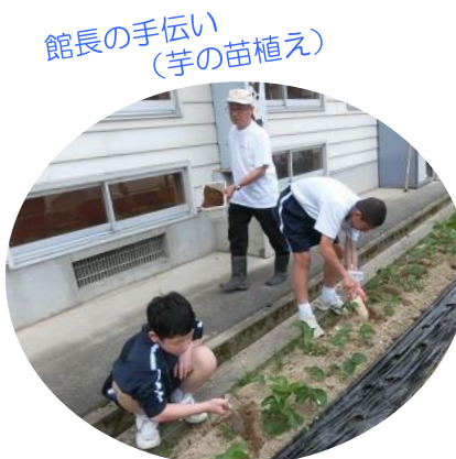
館長の手伝い(芋の苗植え)