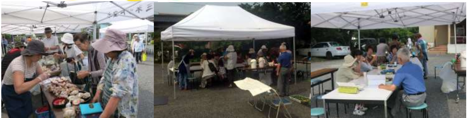
宝木地区公民館駐車場にて、「ふれあい市 春」を開催