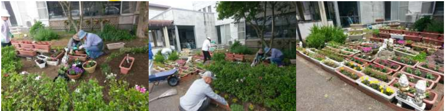
桜土手・花壇整備委員及び花壇ボランティアによる、花壇整備