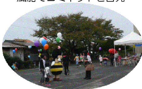
風船でコミネットを啓発