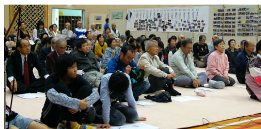
講演会 因幡のお城 あれこれ