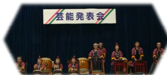
第30回記念 逢鷲太鼓演奏