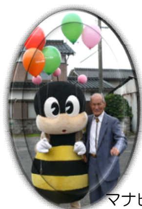
マナビィー大人気