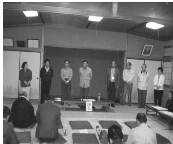
新役員が承認され、総会で紹介されました

任期満了に伴い、新しい役員体制となりました。協議会の名称も「人権啓発推進協議会」と変わり、新しい気持ちで役員一同まい進する気持ちであります。そのためには校区の皆さまのご協力が必要で。今年一年よろしくお願ひします。たより担当者