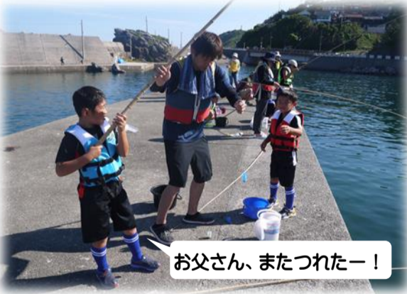
お父さん、またつれたー!

子どもは海釣りの経験がほぼありませんでしたが、講師の方のご指導のもと、竹の竿を上手に使ってチャレンジしていました。