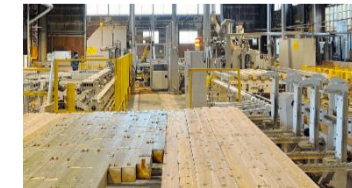
久本木材株式会社