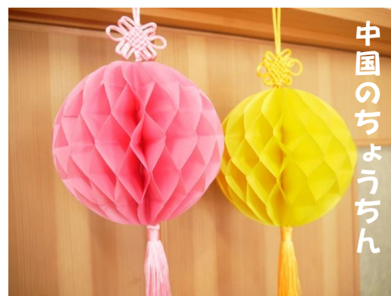
中国のちょうちん