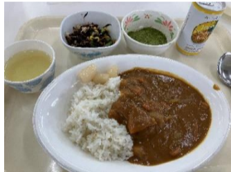
自衛隊と一緒に食べた昼食

駐屯地到着早々、担当者の指示に従い分刻みで、記念撮影・部隊紹介・昼食(カレーライス)・資料館閲覧・戦車の前で記念撮影・売店で買い物(自由行動)の順で、有意義な時間を過ごさせていただきました。