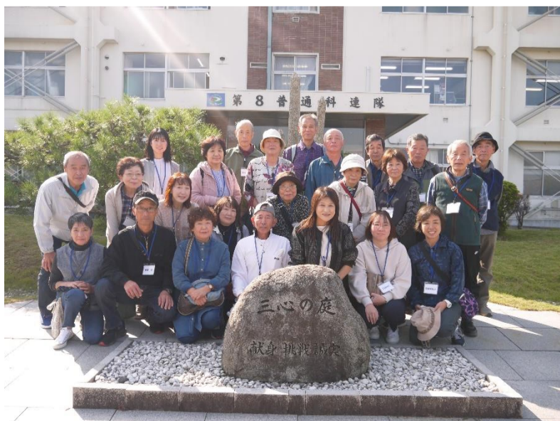
第8普通科連隊玄関前